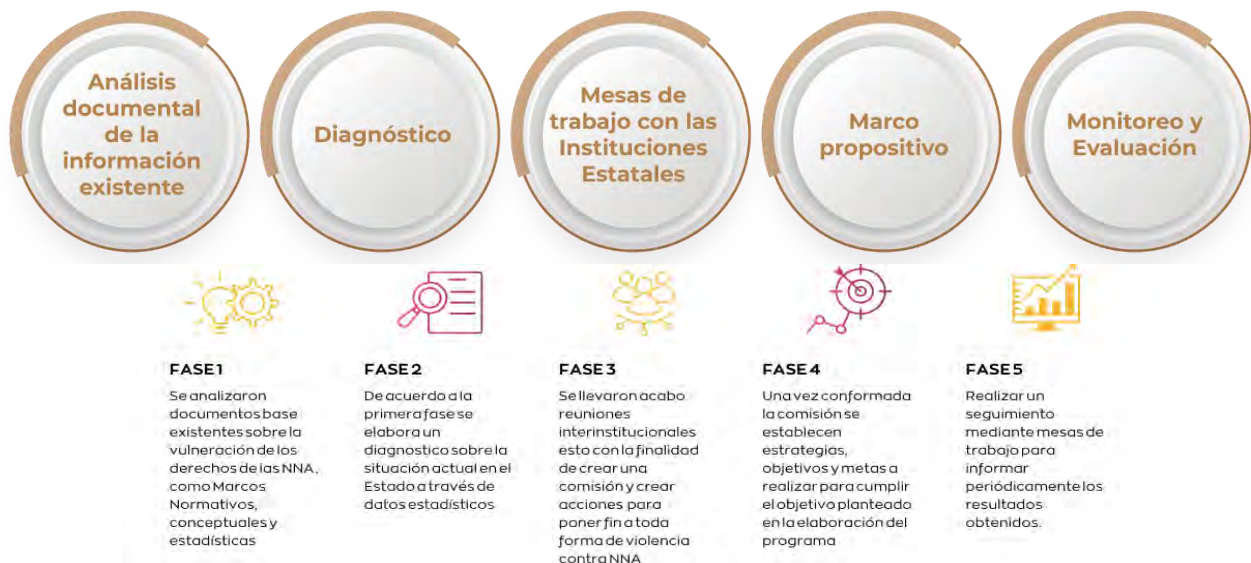
Esquema 1. Fases del proceso metodológico para la formulación del programa