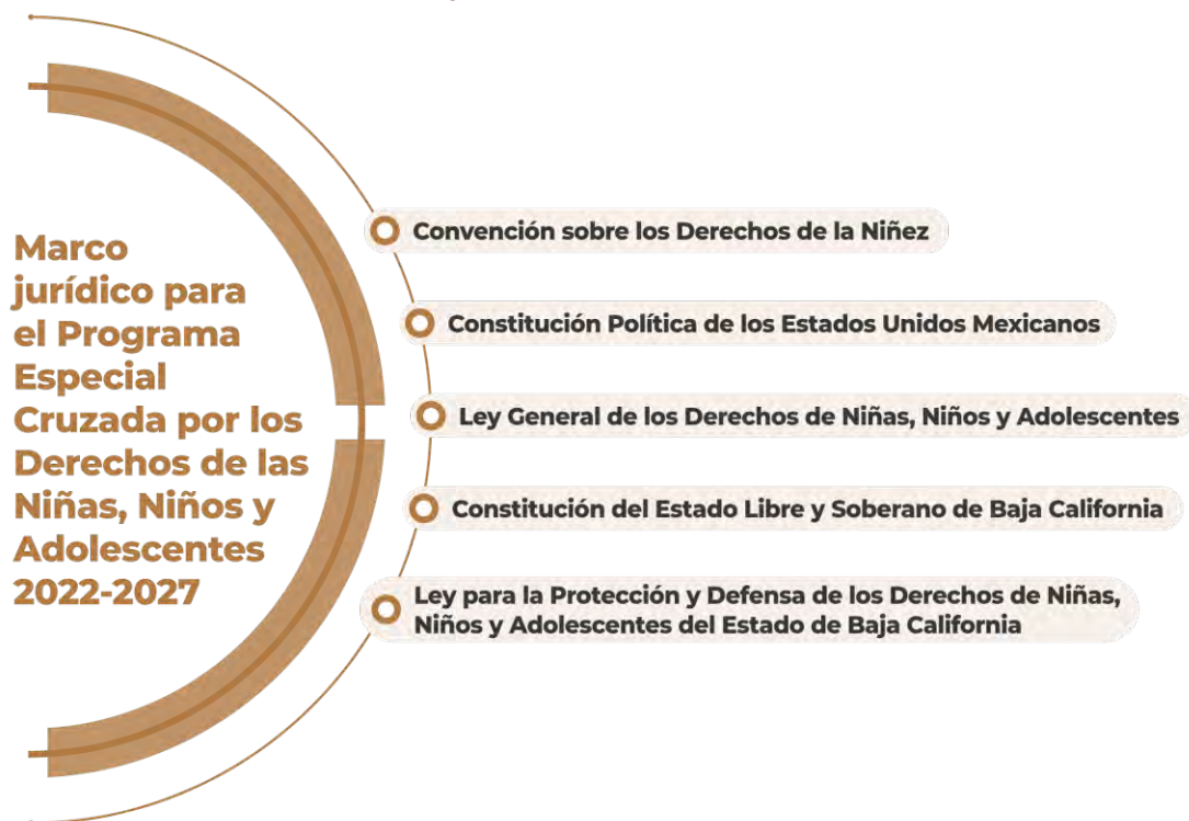
Figura 2. Marco jurídico para el Programa Especial Cruzada por los Derechos de las Niñas, Niños y Adolescentes 2022-2027

Fuente: Elaborado por COPLADE con información de DIF Baja California.